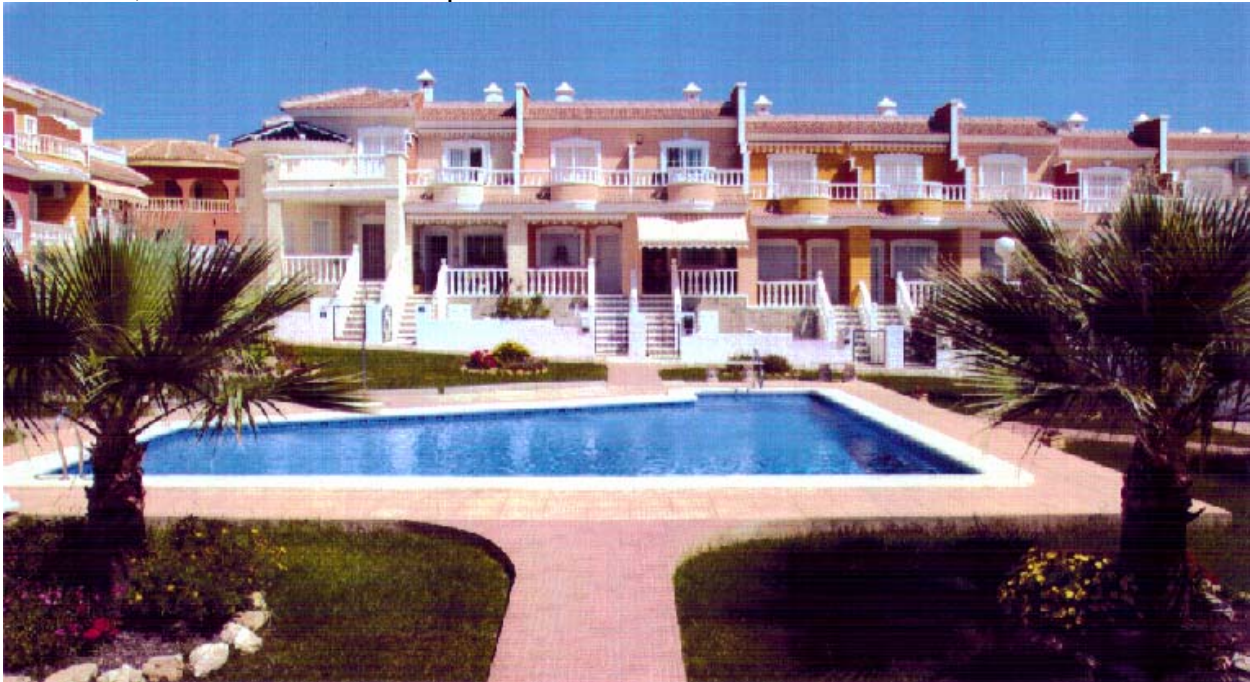
Duplex Fortuna, Urbanisatie Doña Pepa